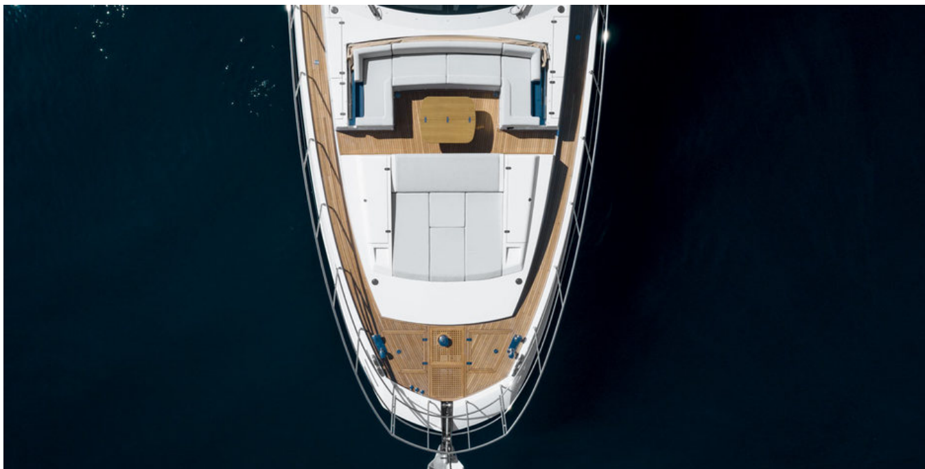
Носовая часть палубы