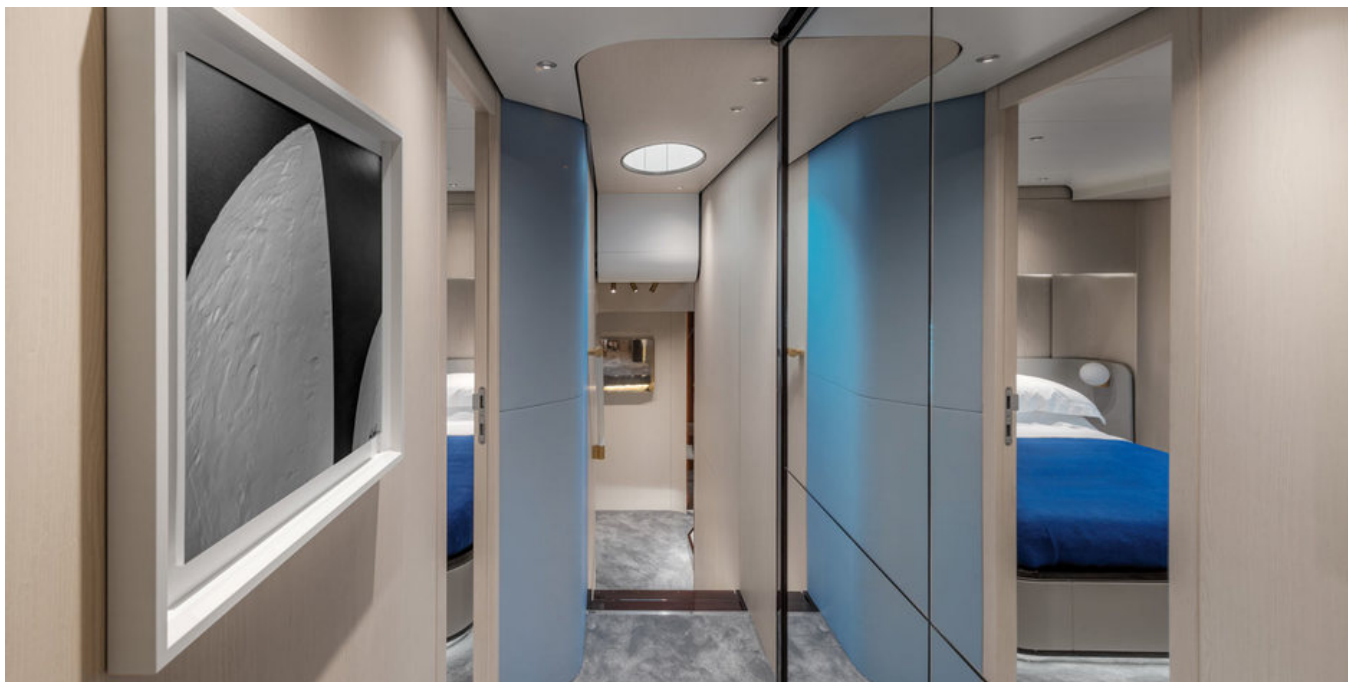
Коридор на нижней палубе