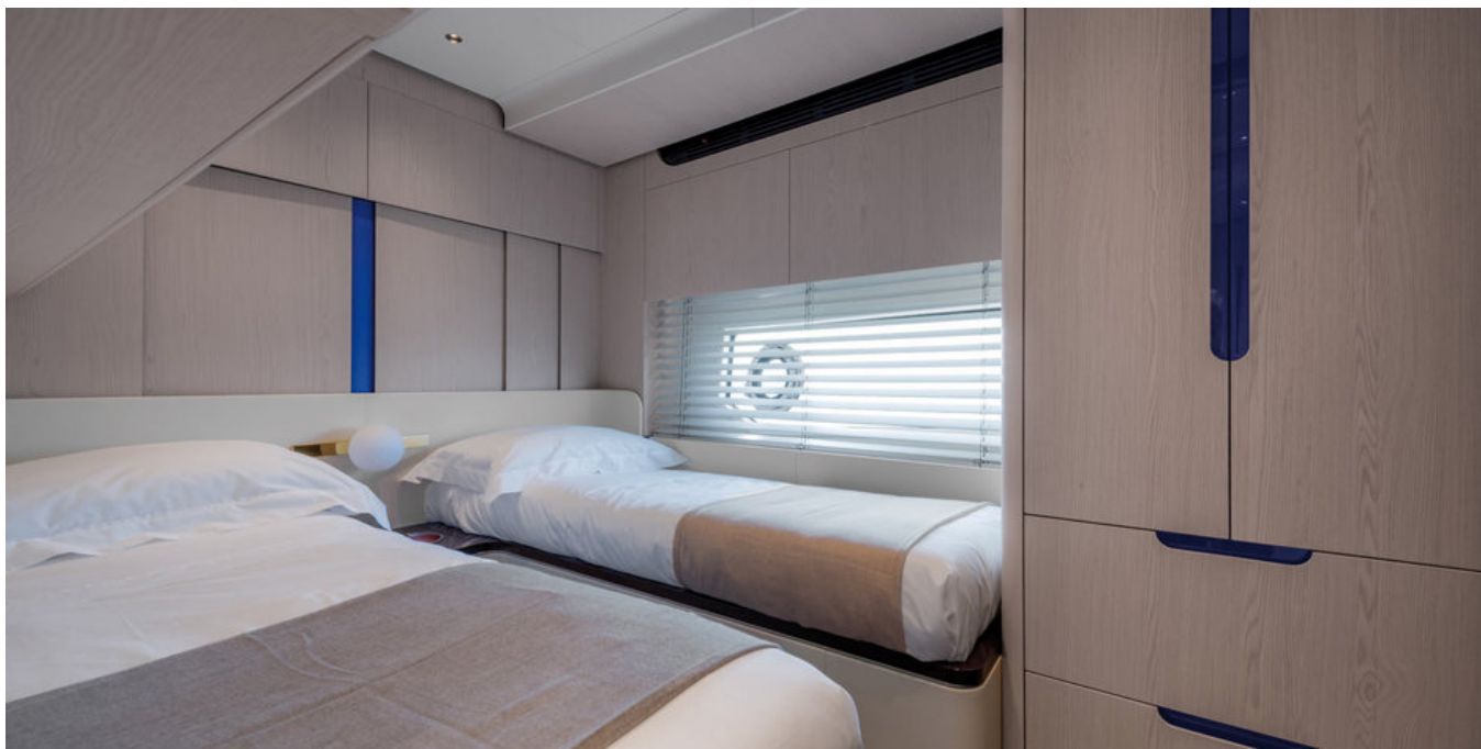
Гостевая каюта по левому борту