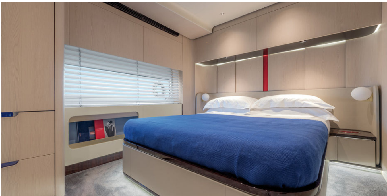
Гостевая каюта по правому борту