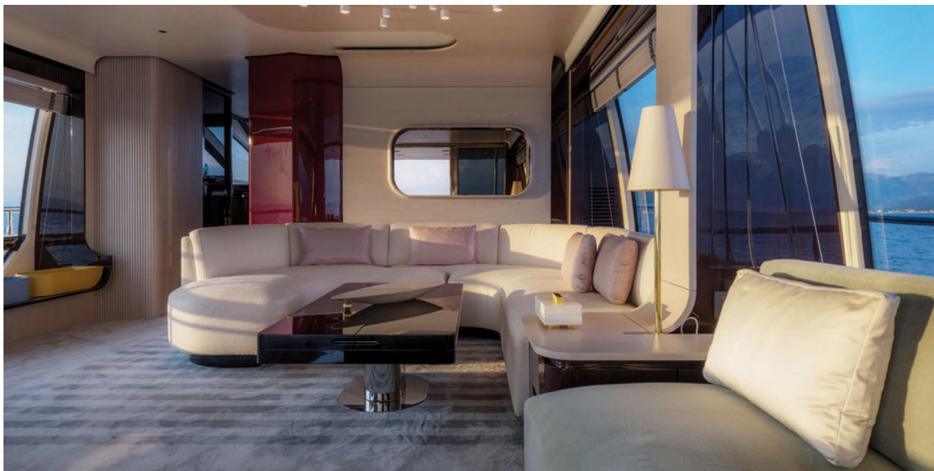
Салон на главной палубе