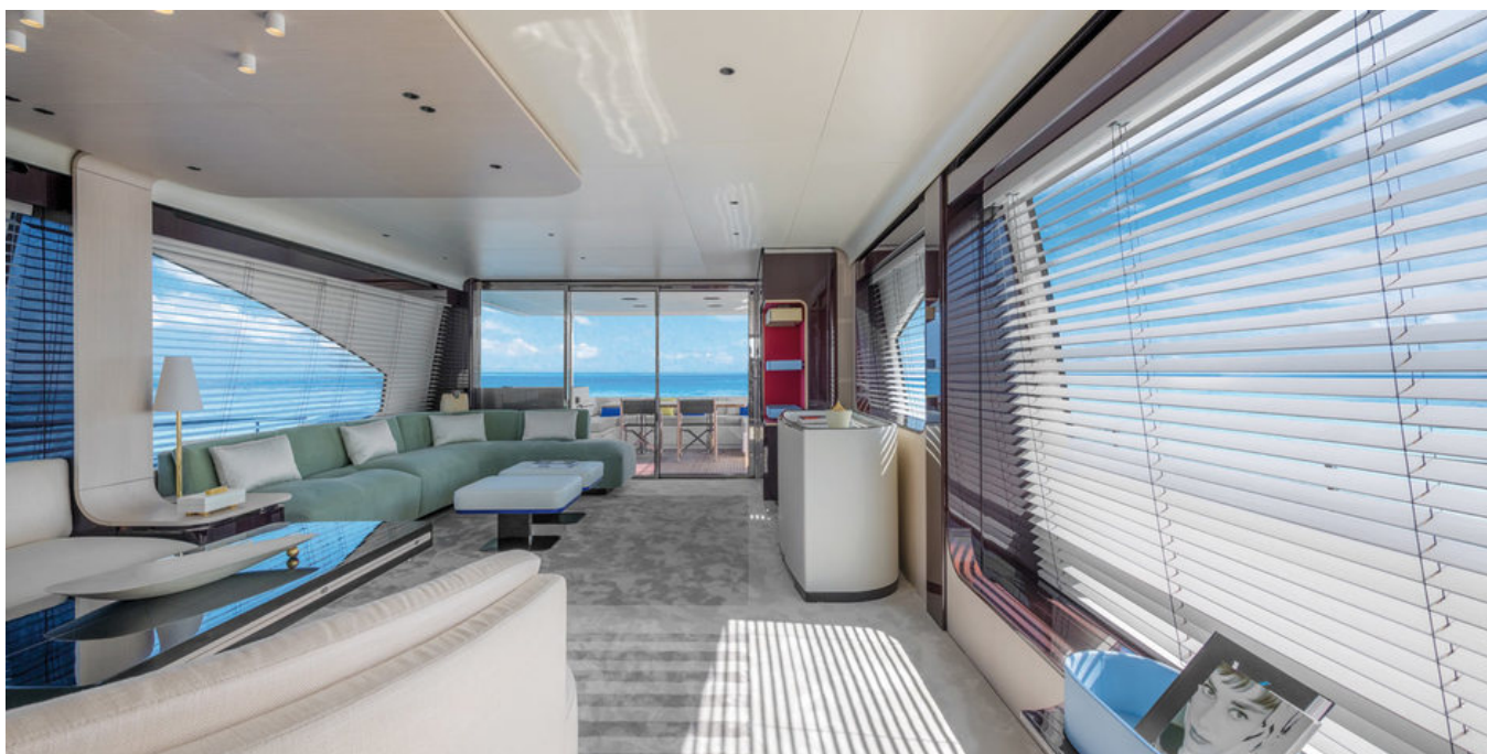
Салон на главной палубе