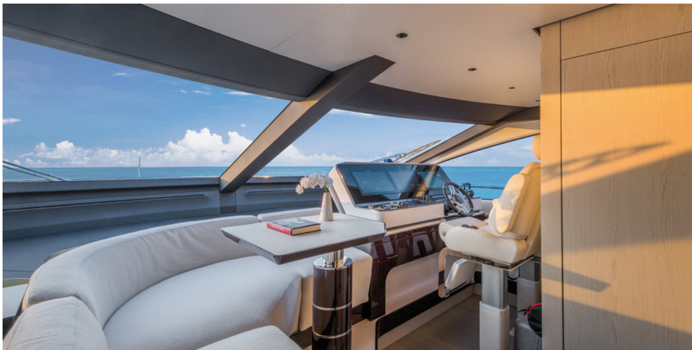
Главный пост управления