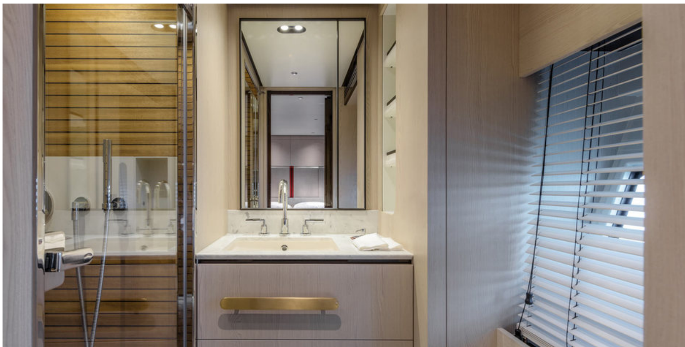
Гостевой санузел по правому борту