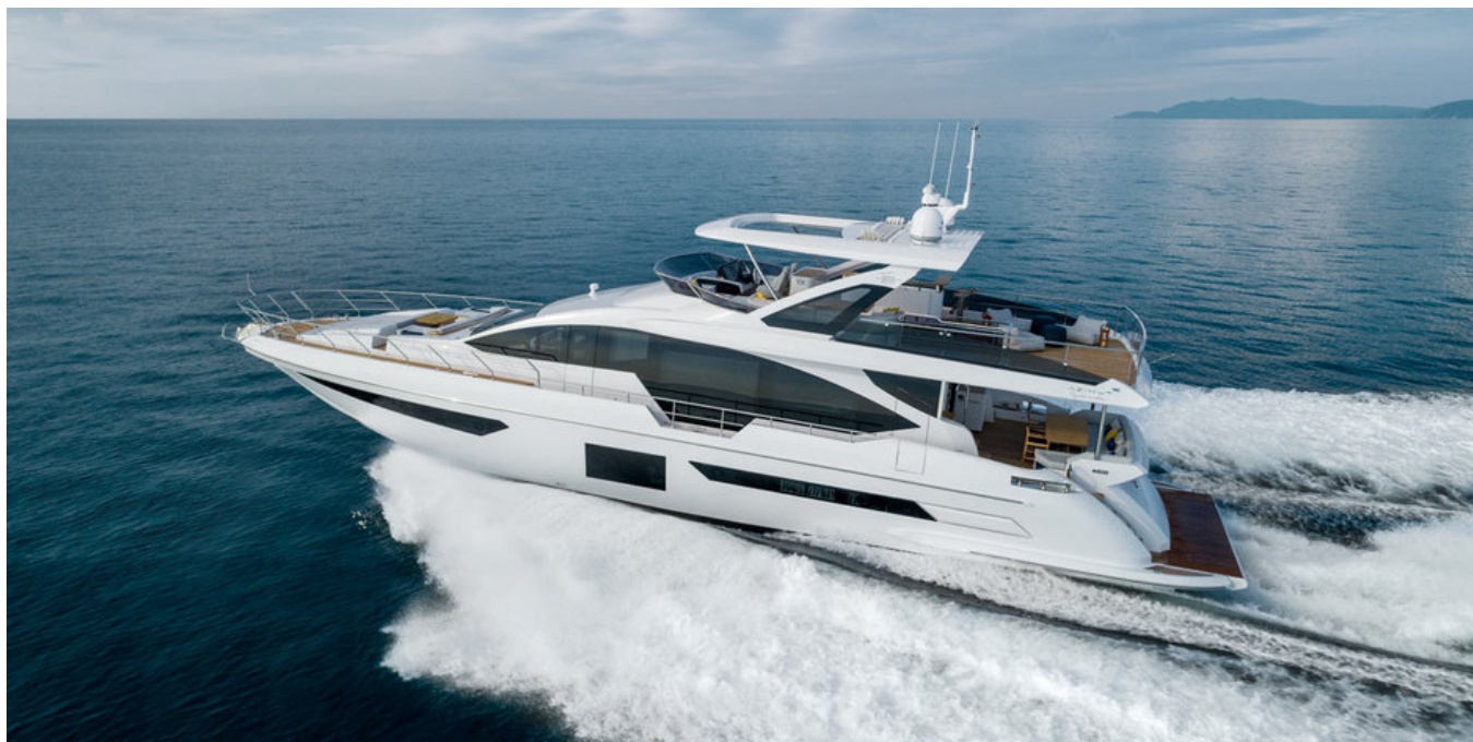
Экстерьер Azimut Grande 25 METRI