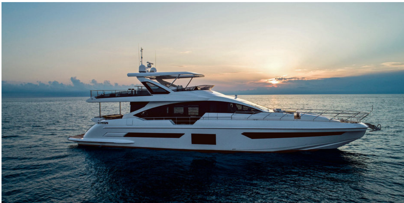
Экстерьер Azimut Grande 25 METRI