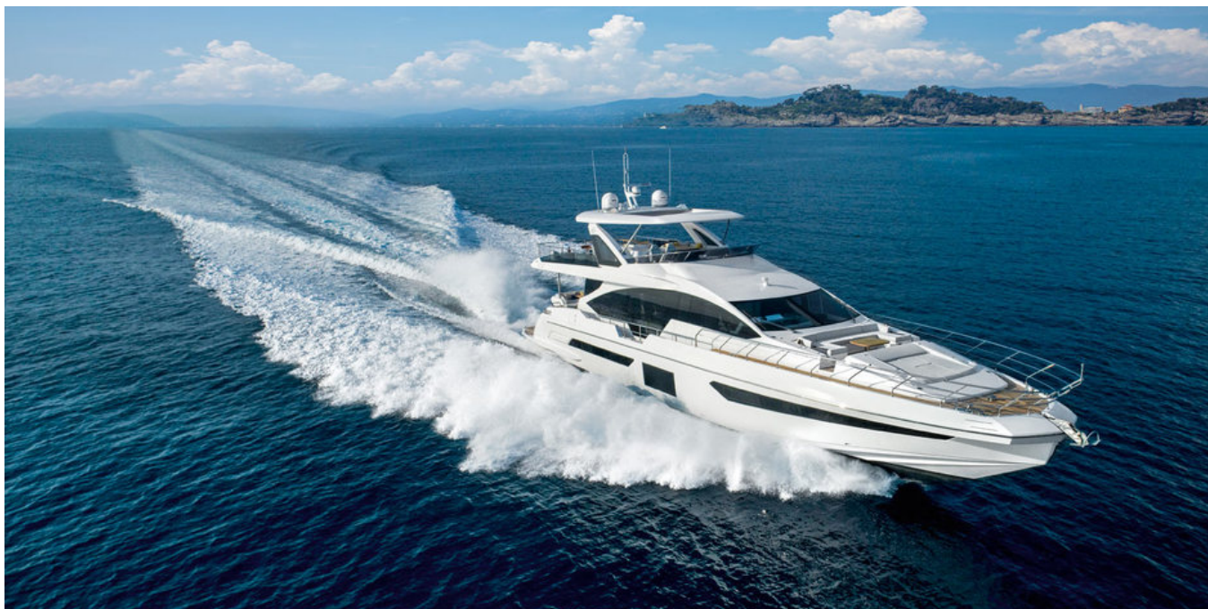
Экстерьер Azimut Grande 25 METRI