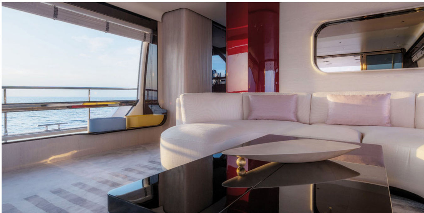
Салон на главной палубе