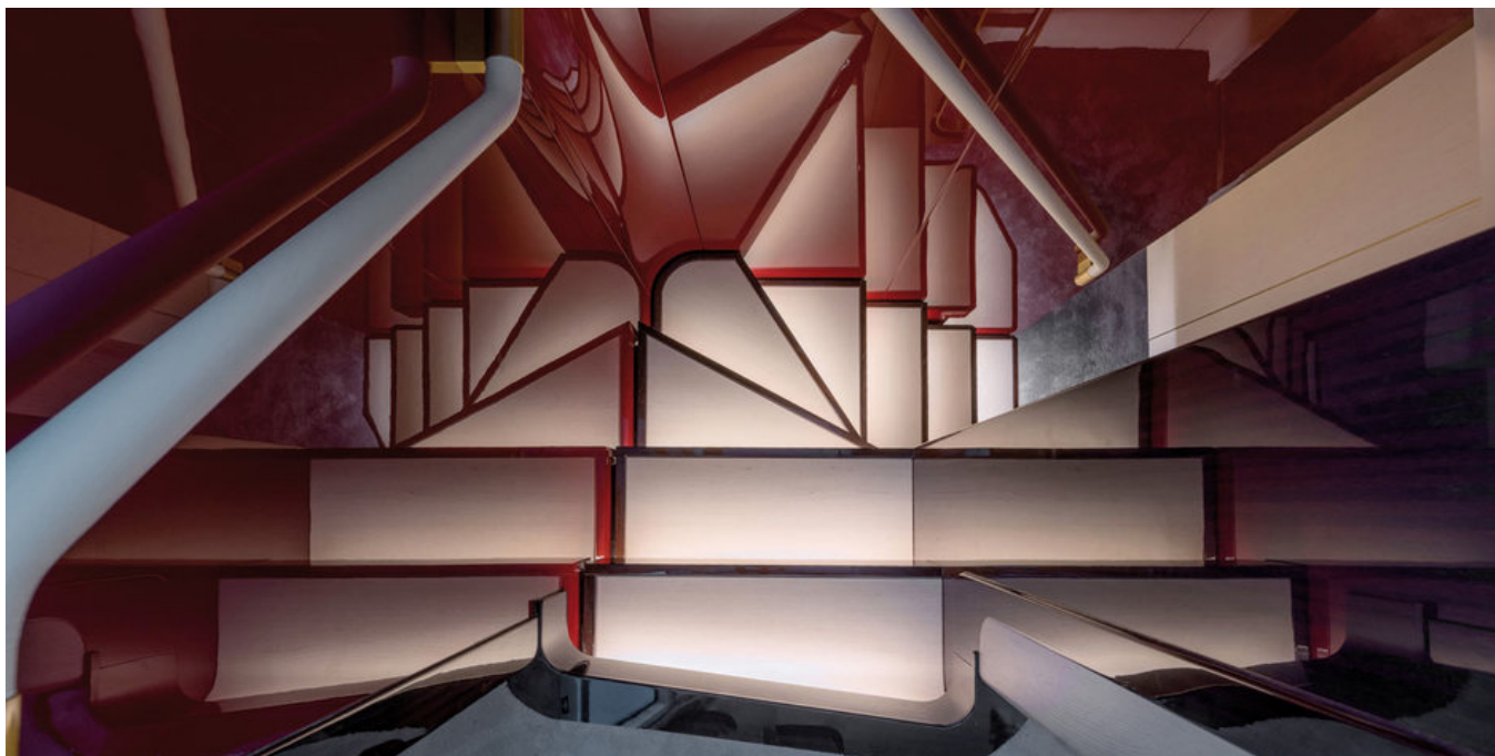
Ступени на нижнюю палубу