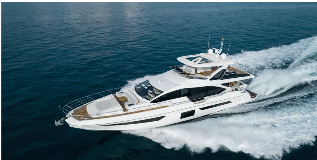
Экстерьер Azimut Grande 25 METRI