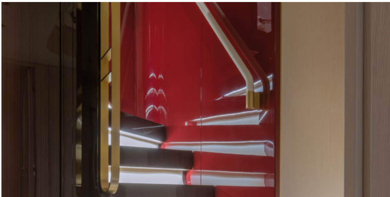
Ступени на нижнюю палубу