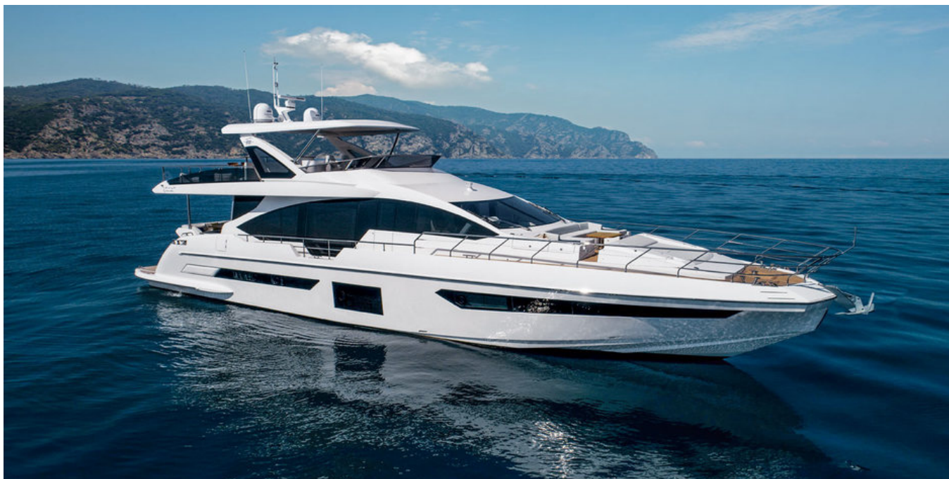
Экстерьер Azimut Grande 25 METRI