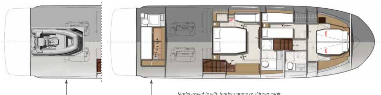
Model available with tender garage or skipper cabin