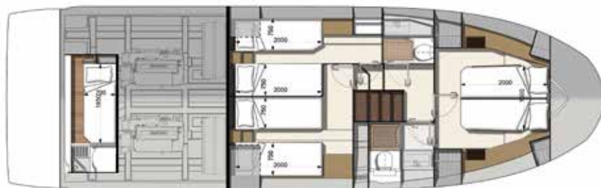
Model available with 2 or 3 staterooms