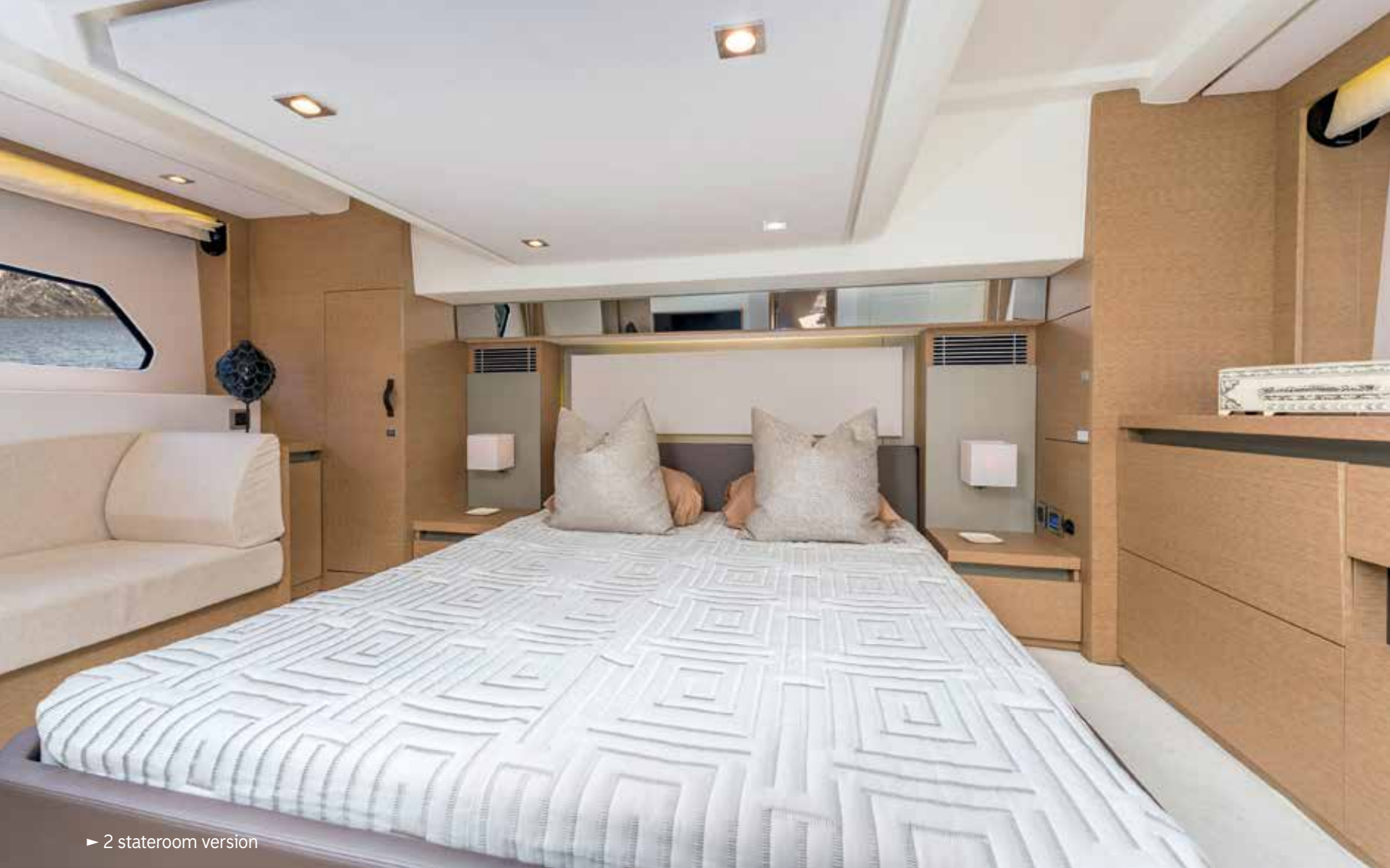
► 2 stateroom version